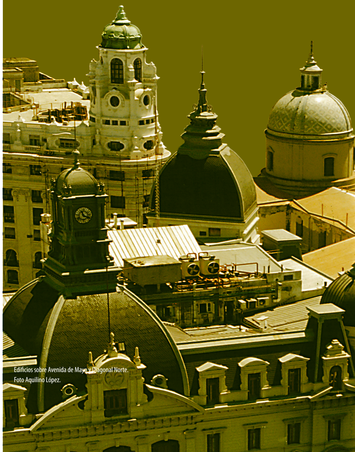
Edificios sobre Avenida de Mayo y Diagonal Norte.