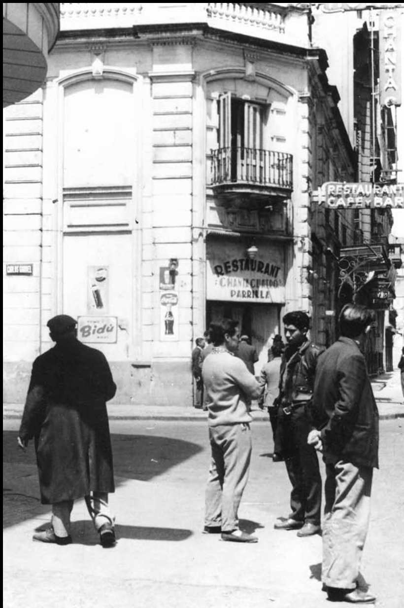
CARLOS GARDEL Y ANCHORENA. RESTAURANTE EL CHANTACUATRO. 20 DE OCTUBRE DE 1962.