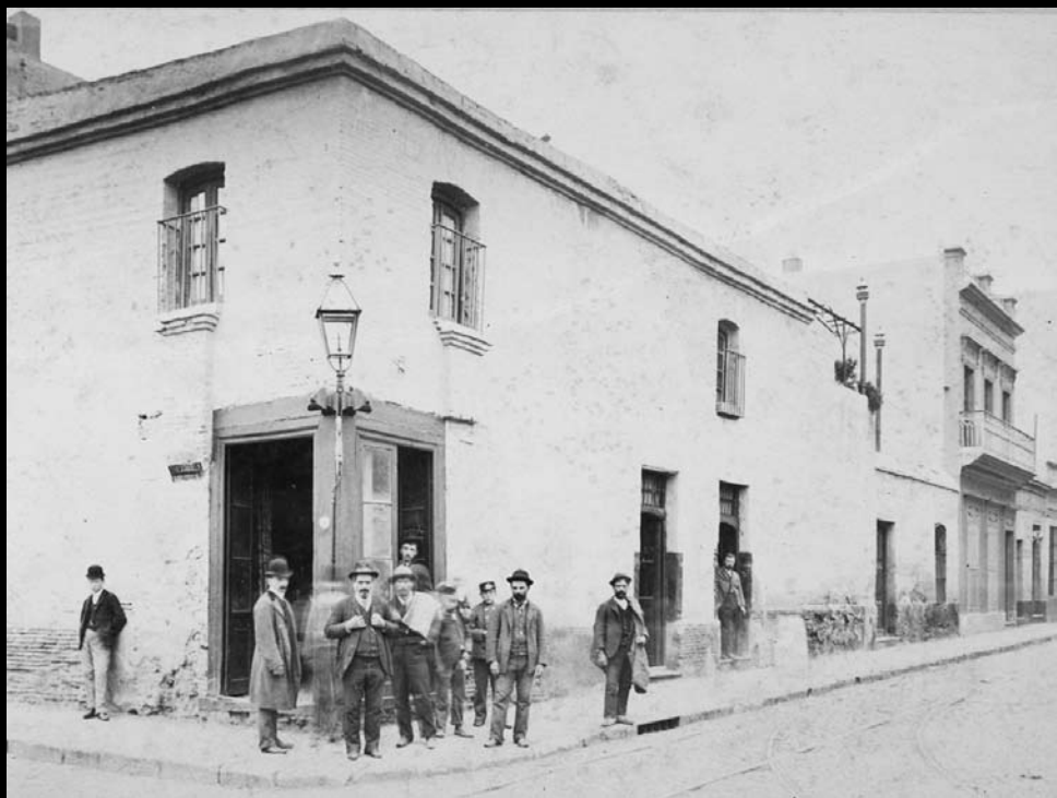
PULPERÍA DE SALOMÓN, PRESIDENTE DE LA SOCIEDAD POPULAR RESTAURADORA EN 1840. ESQUINA CALLES CERRITO Y CORRIENTES, 1891. Museo Histórico de Buenos Aires "Cornelio de Saavedra"