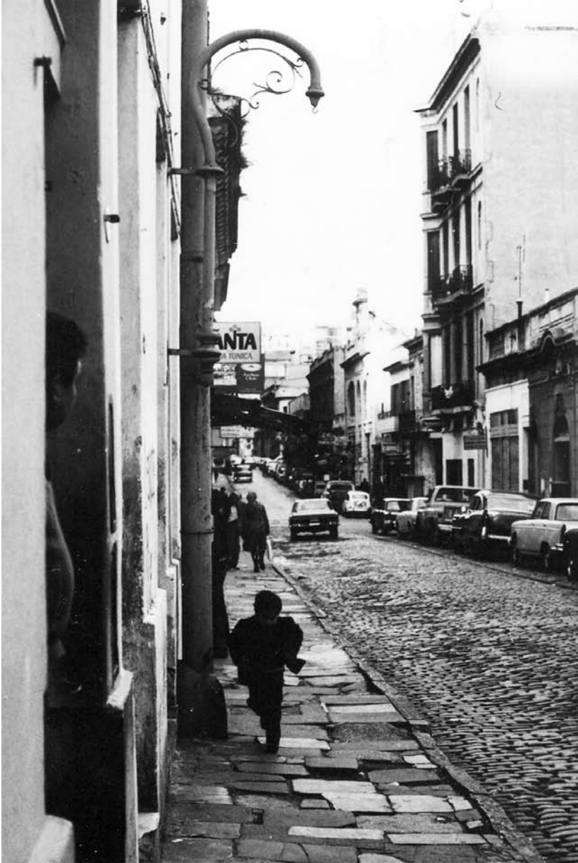
ESTADOS UNIDOS AL 500. 8 DE MAYO DE 1976